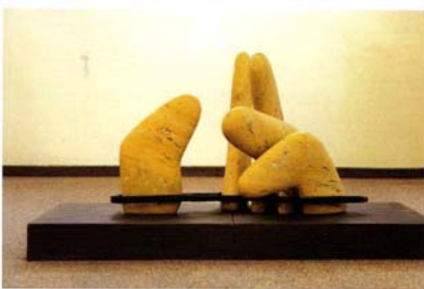
El tema era "manos"