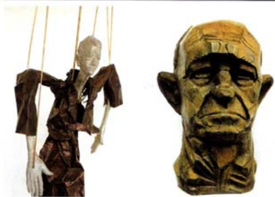
Dos trabajos de alumnos sobre "retrato"

Zundelovitch se largó a la aventura prácticamente solo. Sabía que por lo menos al comienzo contaría con alumnos de alta posición económica que, por algún motivo, tienen tiempo libre, capacidad y deseos de aprender. Así fue, pese a lo cual no bastaba para mantener la escuela, y por lo tanto equilibraba los balances con trabajos privados que daban los ingresos necesarios: fundiciones de esculturas que le presentaban en modelos, pero que había que hacerlas en una escala mayor y el artista por lo general no sabía cómo hacerlo.