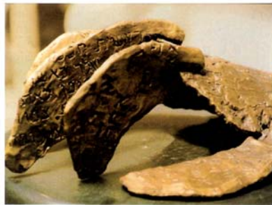
Las manos y sus hábiles expresiones