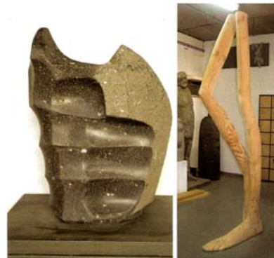
A la izquierda, en piedra, obra de un alumno para el proyecto "manos". A la derecha, en madera, una creación aún inconclusa de Zundelovitch